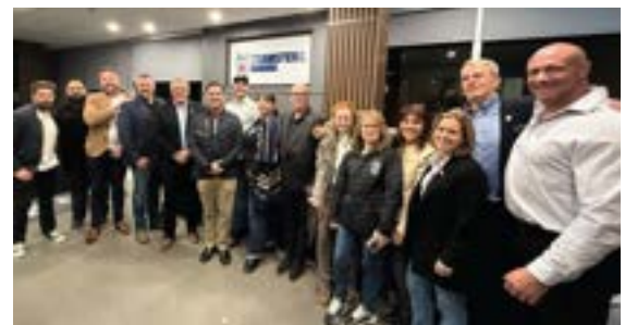
Formation des instructeurs des Teamsters. Plus d'une douzaine de représentants syndicaux de tout le pays se sont réunis pour apprendre de nouvelles techniques de formation et d'intégration technologique.