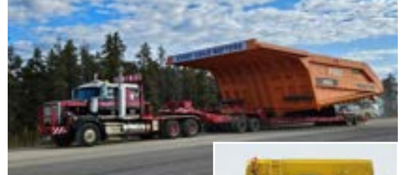
Les membres de la Section locale 362 transportent de l'équipement lourd à travers l'Alberta.