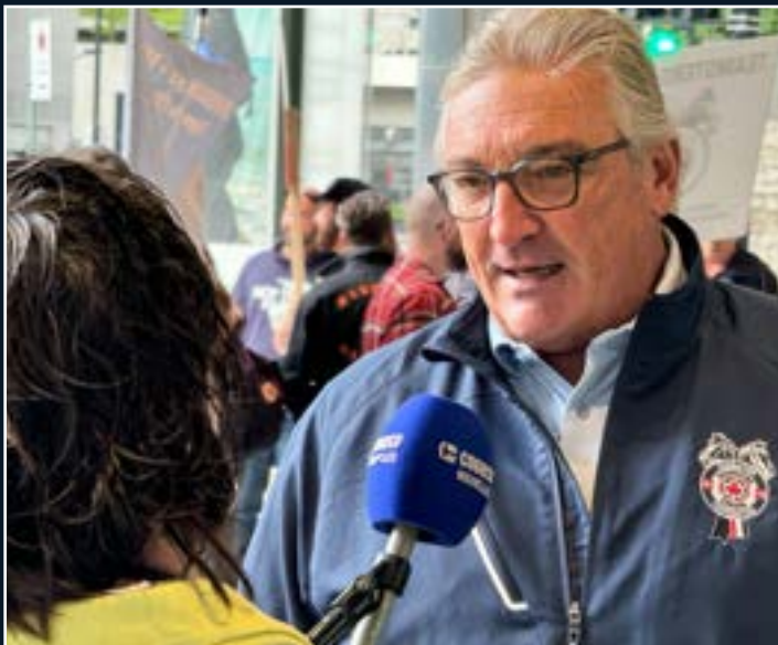
François Laporte, président de Teamsters Canada, lors d'un rassemblement devant le siège social du CN à Montréal.