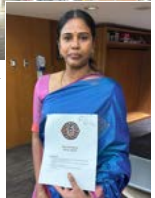
Les membres des Teamsters du Brampton Civic Hospital, du Etobicoke General et du Brampton Memorial ont voté tout au long de la journée et ont adopté une convention historique à 84 %. Une belle victoire pour ces travailleurs de la santé !