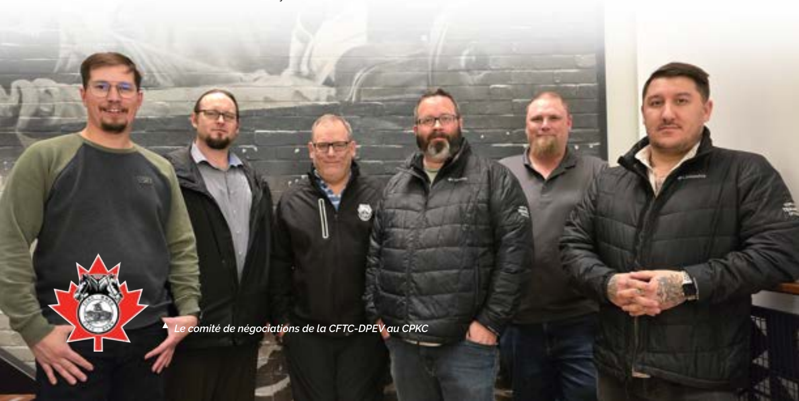
▲ Le comité de négociations de la CFTC-DPEV au CPKC

Ensemble, nous saurons affronter les défis à venir avec confiance et détermination.