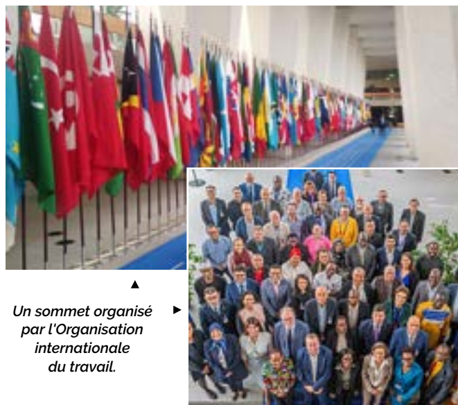
▲ Un sommet organisé par l'Organisation internationale du travail.

En octobre, j'ai eu l'honneur d'être un des deux délégués nord-américains sélectionnés pour assister à une réunion tripartite historique parrainée par l'Organisation internationale du Travail (OIT). Cet événement, qui a réuni plus de 26 syndicats, 25 employeurs multinationaux et des représentants de plus de 36 pays, visait à élaborer un document de l'OIT appuyant un travail décent et une transition juste dans le secteur des matériaux de construction, dont celui du ciment.