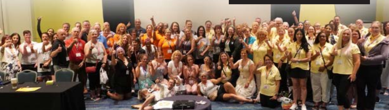
La Conférence des femmes des Teamsters 2024. L'atelier canadien de cette année a mis en lumière la richesse que l'équité et la diversité apportent aux syndicats. Grâce à des activités interactives, les participants ont appris à reconnaître l'impact de nos préjugés sur nos décisions, nos membres et les actions de notre syndicat. Les participants sont repartis avec de nouvelles compétences pour créer des lieux de travail inclusifs et renforcer le militantisme syndical.