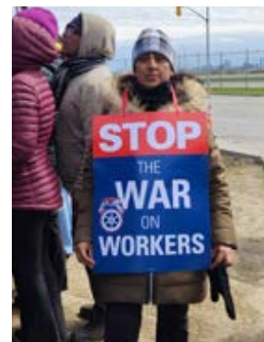
Plus de photos de la grève de Gate Gourmet à la page 29

Unis, nous sommes plus forts. Unis, nous parlons d'une voix plus forte. Et, unis, nous veillons à ce que l'avenir soit prometteur pour les travailleurs et travailleuses, les familles, ainsi que tous les Canadiens et Canadiennes.