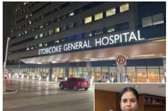
Les trois hôpitaux ontariens du système de santé William Osler ont massivement ratifié une nouvelle convention collective de quatre ans.