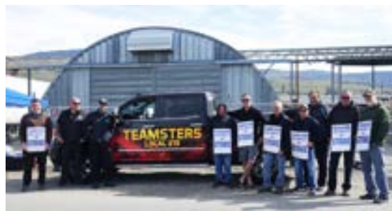
Les membres de GFL Environmental à Kelowna ont ratifié leur première entente avec la Section locale 213 des Teamsters après une grève/un lock-out qui a débuté le 25 mars 2024.