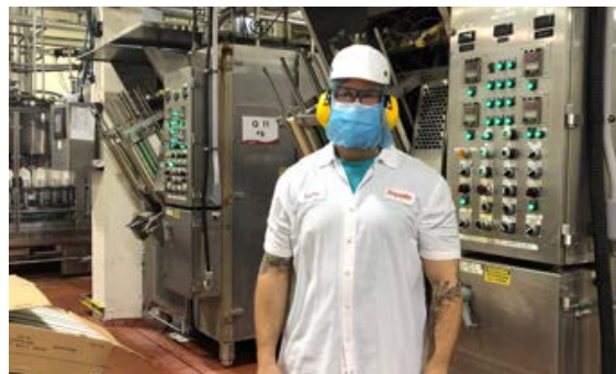
▲ Un syndiqué de Saputo

Il y a de bonnes nouvelles en provenance de Mount Pearl (Terre-Neuve-et-Labrador), où l'entrepôt de laiterie endommagé par un incendie plus tôt cette année a été vendu par Agropur à la coopérative laitière de la province. La Section locale 855 a veillé à ce que le contrat existant soit respecté, et des investissements locaux contribueront à la stabilité des emplois.