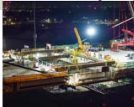
▲ Le projet du pont Gordie Howe sera achevé et ouvert à l'automne 2025.

De grands projets se poursuivent à l'échelle du pays dans plusieurs secteurs d'importance (infrastructures civiles lourdes, énergie, nucléaire, hydroélectricité, pétrole et gaz). De nombreux projets de construction industriels, commerciaux et institutionnels sont également en cours d'exécution ou de planification.