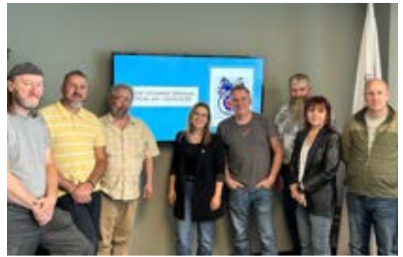
Session de formation avancée pour les délégués de la Section locale 647 en Ontario, spécialement conçue pour les délégués ayant de 5 à 10 ans d'expérience.

Nous sommes fortement engagés envers les techniques d'apprentissage numériques de demain, en complément des méthodes classiques. L'évolution d'EduCan et de notre système de gestion de l'apprentissage se poursuivra, notamment par l'ajout de fonctionnalités (questionnaires interactifs, parcours personnalisés, ressources complémentaires pour le soutien de formations flexibles et à la demande, etc.). Cette approche, qui conjugue la technologie et les valeurs de notre syndicat, génère une expérience d'apprentissage dynamique et accessible.