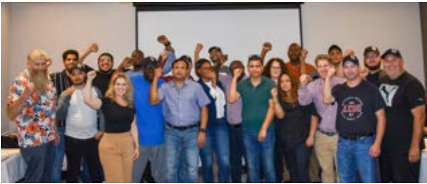
Séance de formation pour les délégués de la Section locale 647 de l'Ontario.

Nous nous sommes employés à créer du contenu canadien pour maintenir la pertinence et la valeur informative de nos programmes. Soucieux de bien cerner nos besoins, nous avons participé à plus de dix cours de formation pour délégués syndicaux (ou les avons présentés) et créé des ateliers sur notre historique et nos interventions politiques au niveau fédéral, ainsi que leur portée actuelle pour les Teamsters. Nous avons également produit du contenu sur les thèmes du harcèlement psychologique, de la diversité et de l'inclusion, etc. De plus, c'est avec fierté que nous avons représenté le Canada et partagé de l'information avec nos consœurs de l'étranger lors de deux ateliers à la Conférence des femmes de la FIT.