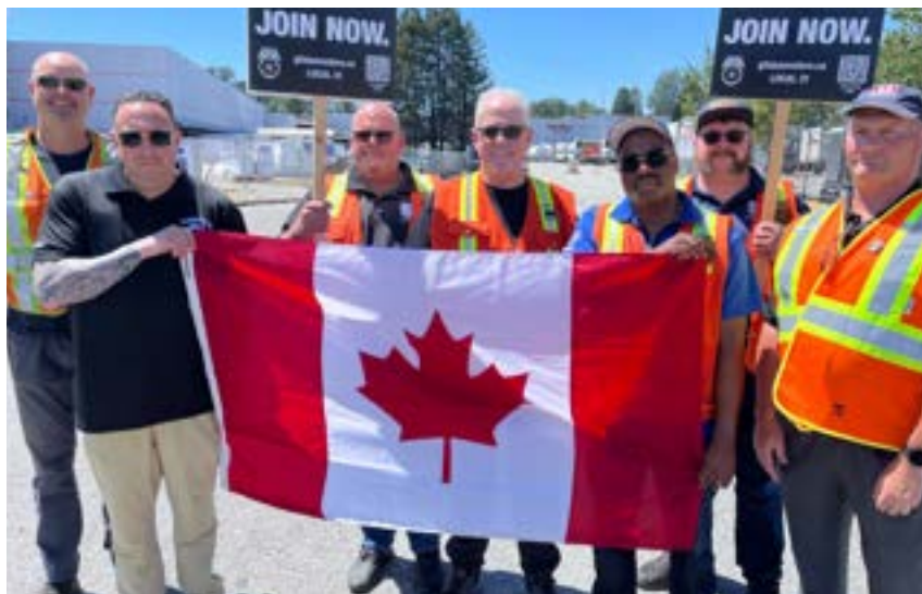
Après des années d'efforts, plus de 550 travailleurs de Gordon Food Service Canada en Colombie-Britannique sont maintenant représentés par les Teamsters.