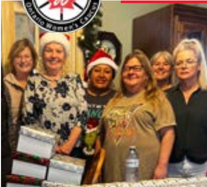
▲ La Section locale 938 des Teamsters et le Caucus des femmes de Teamsters Ontario ont fait un don de 1 000 $ à la section de Mississauga du projet Shoebox.