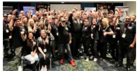
Semaine annuelle de formation du Conseil conjoint 36 des Teamsters. Cet événement d'une semaine a rassemblé plus de 70 délégués syndicaux et officiers de partout en Colombie-Britannique et au Yukon.