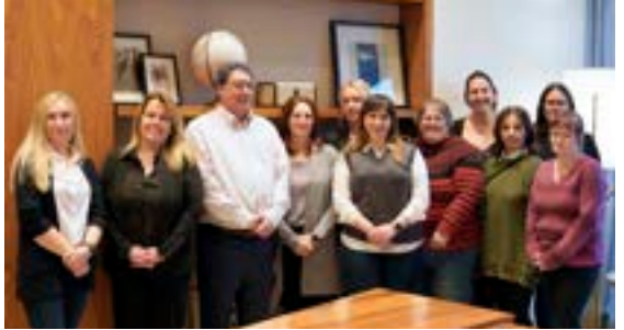
Une partie du comité d'équité salariale de Purolator.

Purolator a mis ces rajustements en œuvre le 4 septembre 2024, dans le respect des délais prévus. Teamsters Canada, qui a veillé à une progression juste et transparente du processus jusqu'à sa conclusion, a pu constater que des ébauches des plans d'équité salariale ont été affichées sur les lieux de travail durant 60 jours avant leur mise en application. Nos membres ont donc pu en examiner la teneur avant le stade de la finalisation.