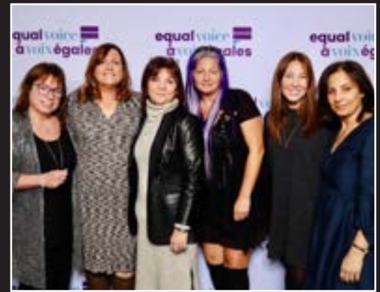
▲ Teamsters Canada est fier d'avoir participé au Gala de la fondation À voix égales, un événement inspirant qui vise à promouvoir l'engagement social et l'autonomisation des femmes.