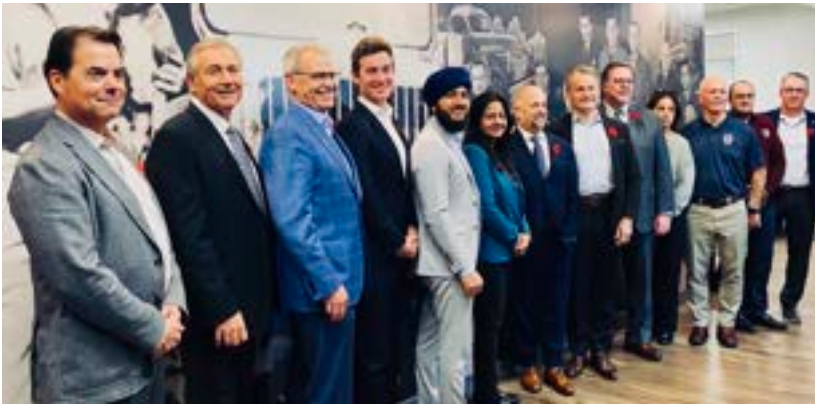
▲ Des représentants de l'Alliance canadienne du camionnage, de Teamsters Canada et du gouvernement fédéral annoncent de nouvelles mesures pour lutter contre Chauffeur inc.