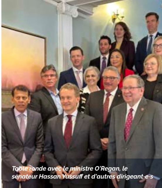
Table ronde avec le ministre O'Regan, le sénateur Hassan Yussuff et d'autres dirigeants