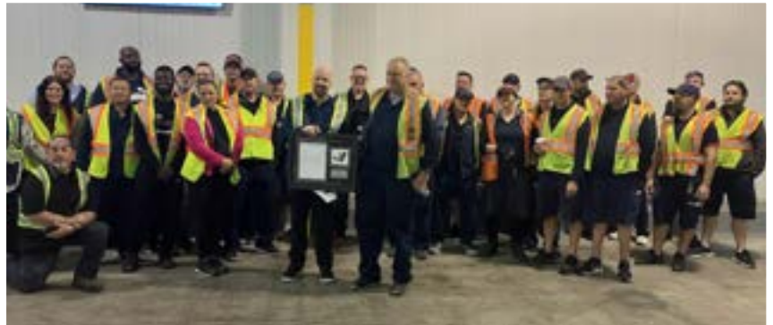
▲ Les membres de la section locale 879 chez Purolator.

En conclusion, l'essor de l'automatisation et de l'intelligence artificielle pose des défis importants. La protection de nos emplois exigera des remparts technologiques renforcés au cours des années à venir. Que ce soit par l'ajout de nouvelles dispositions dans nos conventions ou de l'application vigilante des ententes en vigueur, nos efforts collectifs sont essentiels pour l'avenir. Continuez de faire preuve de rigueur et de soutenir vos sections locales. Collectivement, nous pouvons accomplir de grandes choses.